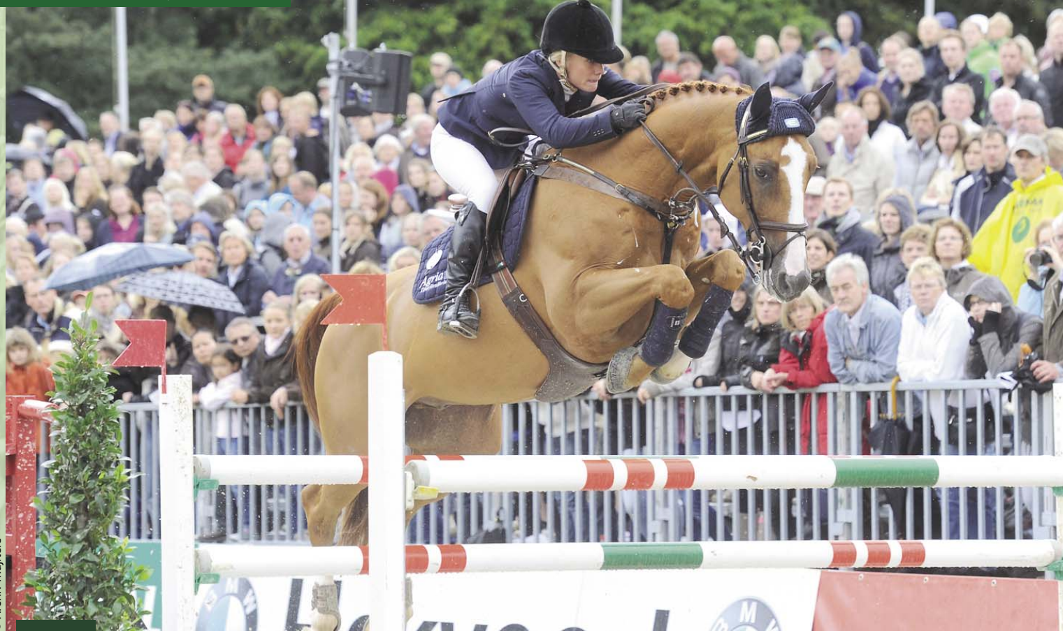
Quick Diamond (Quick Lauro Z z matky po Catango)

1154 QUICK LAURO Z působí v PK ČT, CS a je zařazen do Akceleračního programu, výběr má udělen i v zahraničních PK. Přes svůj již poměrně vysoký věk zapustil v roce 2016 30 klisen s březostí 70%, V roce 2017 19 klisen s březostí 73,68. V roce 2021 bude opět působit v inseminaci čerstvým spermatem.