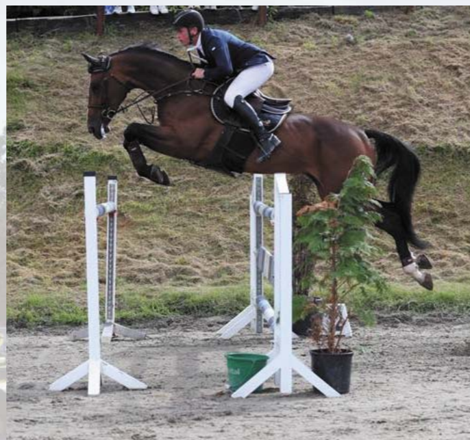
Solomon (z matky po Faust Z), chovatel ZH Písek

populárního bělouše Cornet Obolensky je po Heartbreaker. Heartbreaker je příslušníkem jedné z nejstarších holštýnských linií Achilles skrze Fähnrich.