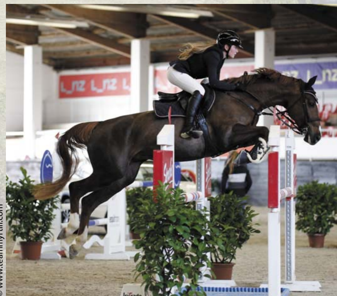
Kigali (z matky po Landos)