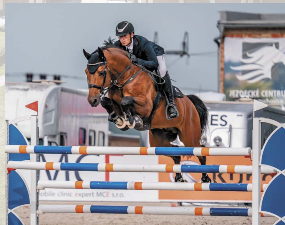
Plemenný hřebec 2189 Heartvit ZH (z matky po Caesar)

Plemenný hřebec 1345 Heartbreak ZH je pro český chov jednoznačným přínosem, jeho potomci jsou charakterní koně s dobrou jezditelností a kvalitní technikou skoku.