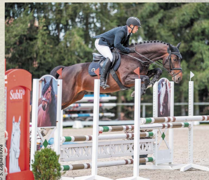
2983 Number One při finále KMK 2022.

Number One působil v roce 2022 v plemenitbě v rámci PK CS, zapustil 29 klisen s vysokou březostí 72,4%. Zároveň se účastnil seriálu KMK, kde byl úspěšný na Hradištku, kde obsadil 4. místo a ve Zduchovicích dokonce zvítězil. Na základě těchto výsledků byl přihlášen k absolvování sportovního tes-