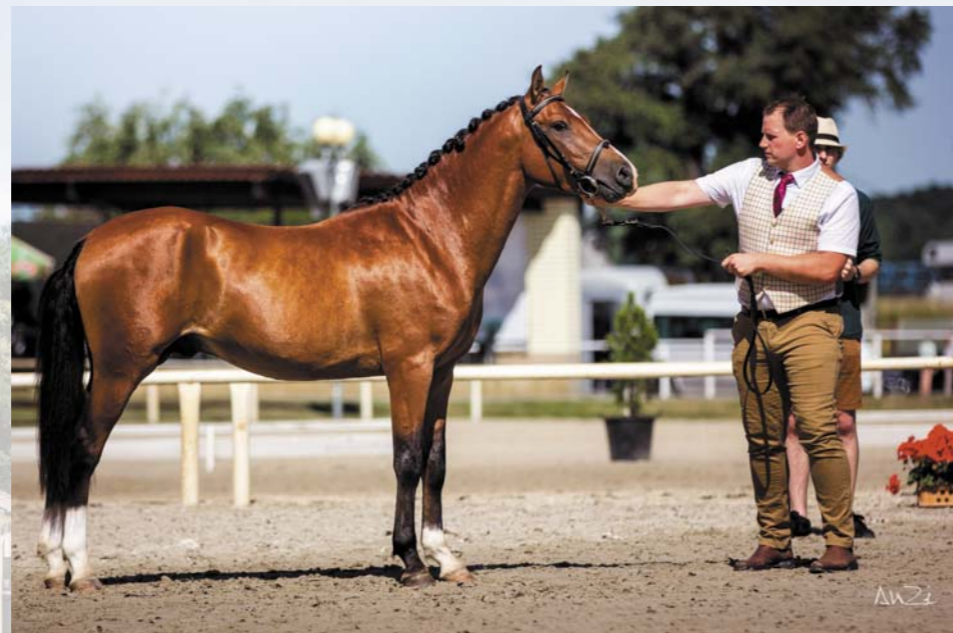
Zavalův syn, plemenný hřebec Sherry Zippo

V roce 2023 bude Zaval i nadále působit v inseminaci v Zemském hřebčinci Písek.